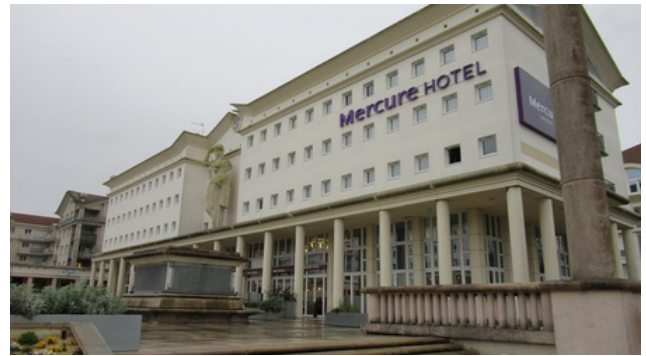
Accès pour personne à mobilité réduite sur la place

Pour l'accès aux personnes à mobilité réduite.